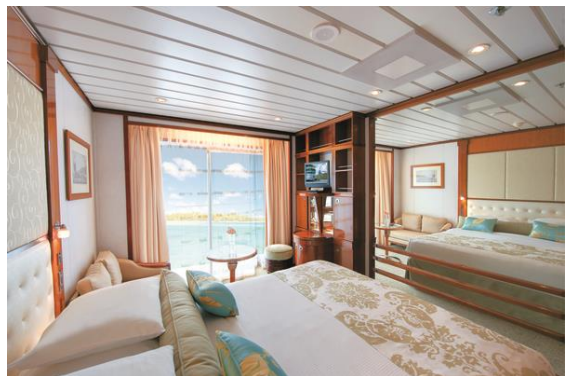
～客室一例～ C/D バルコニー・ステートルーム 22.2 m 2 (プライベートバルコニー付)